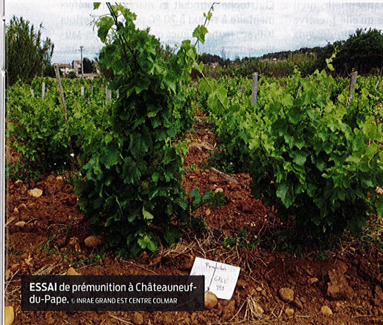
ESSAI de prémunition à Châteauneuf-du-Pape.